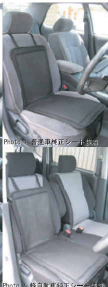
Photo : 軽自動車純正シート装着