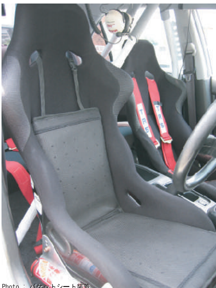
Photo : バケットシート装着