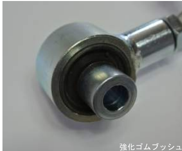
強化ゴムブッシュ