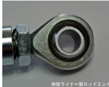
樹脂ライナー製ロッドエンド

車種別調整式スタビリンクにTOYOTA FT86/SUBARU BRZリア用を追加発売します。 ジョイント部には「強化ゴムブッシュ」「樹脂ライナー製ロッドエンド」を採用。静粛性と高剛性を兼ね備えています。 調整量は65mm～77.5mm(純正長95mm)。